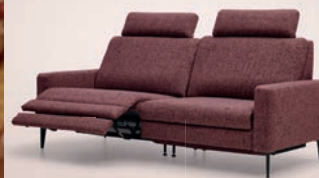
Banken al vanaf 1045,-

→ Bekijk de gehele collectie op www.velderhof.nl of vraag de gratis brochure aan via 0499 - 729 366