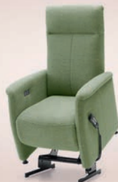
Sta-op stoelen al vanaf 695,-