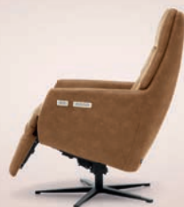
Relaxstoelen al vanaf 395,-