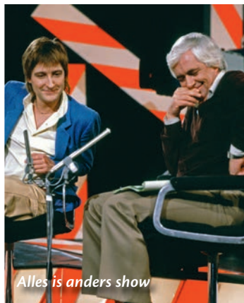
Alles is anders show