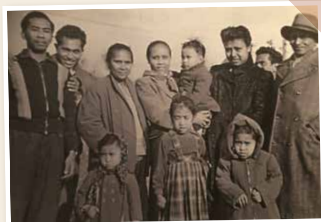
In Schattenberg met familie en vrienden. "Mijn barakgenoten werden mijn nieuwe familie."