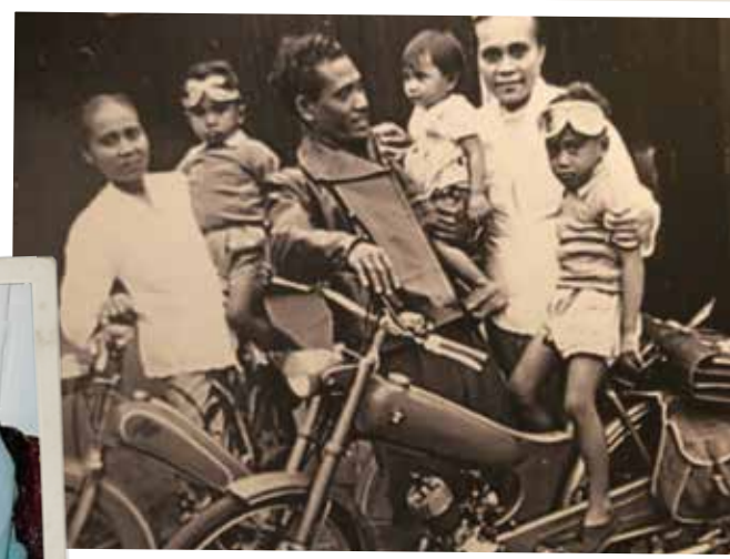
In woonoord De Biezen, tussen Barneveld en Lunteren. "De dorpingen kwam op zondag 'aapjes kijken'. Ze hadden nog nooit donkere mensen gezien."