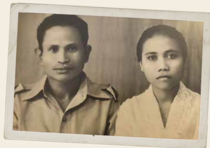
Eind jaren veertig met Ating op Java: "We waren er niet meer veilig."