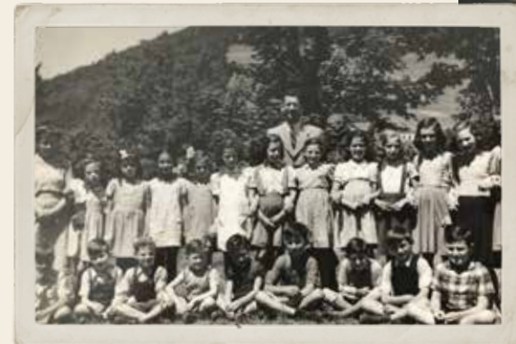
Haar klas op het internaat in Caux, Zwitserland.