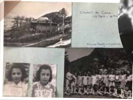
In haar fotoboek staan verschillende foto's uit Zwitserland. "Ik werd naar een internaat in de bergen gestuurd. Een fijne tijd, ik was vrij!"