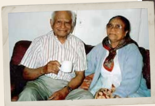
Barneveld, eind jaren 80. "We beseften dat we het hier beter zouden hebben dan daar."