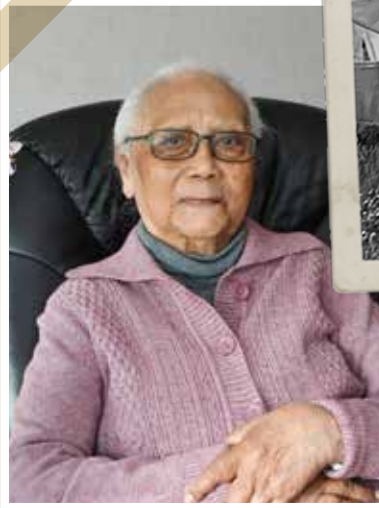
Oma Obe anno 2021.