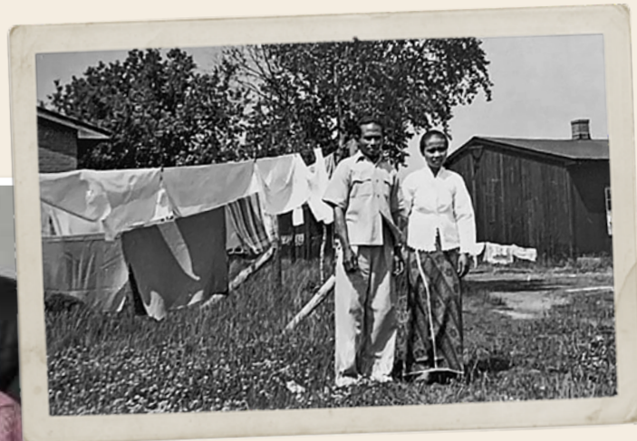
Aanpassen in een voormalig concentratiekamp.