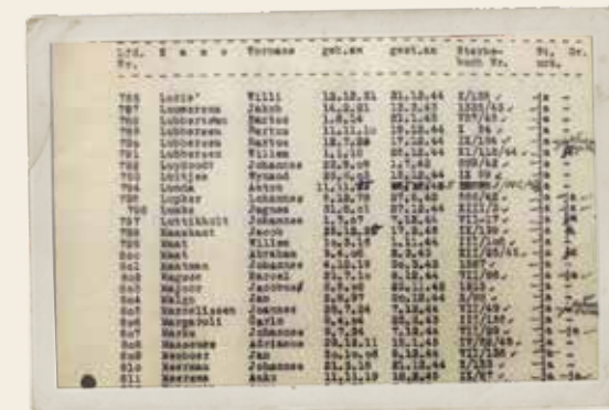
In 2019 kreeg Gerrie eindelijk een officieel document van haar vaders overlijden onder ogen. Achter nummer 789 staat zijn naam.