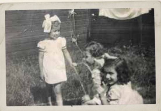
De zusjes eind jaren 30 in de tuin in de Haagse Thorbeckelaan.