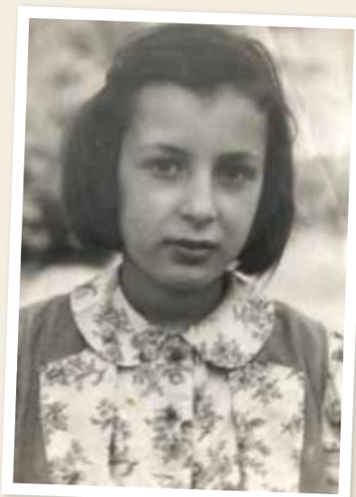
Einde voorjaar 1945 in Zwitserland, wachtend op de terugkeer naar Nederland.