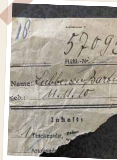
Het inschrijfbewijs met kampnummer van vader Bartus.