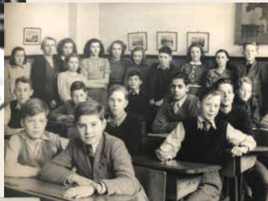
^ Den Haag, eind 1945. "Ik was zo blij dat ik weer naar mijn eigen school mocht."