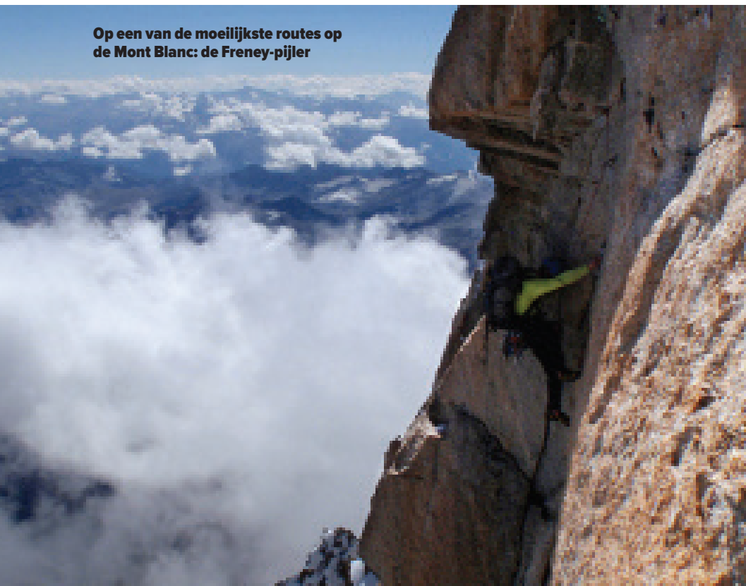
Op een van de moeilijkste routes op de Mont Blanc: de Freney-pijler