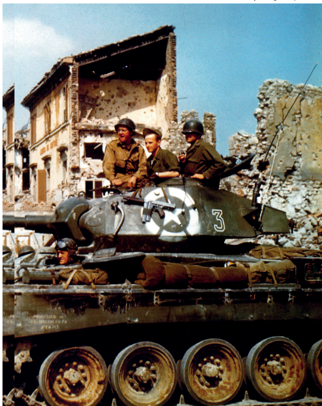
Een Amerikaanse tank nabij Bologna, april 1945.