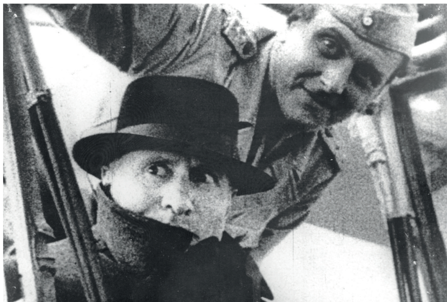
Benito Mussolini (links) met zijn bevrijder Otto Skorzeny, 12 september 1943.