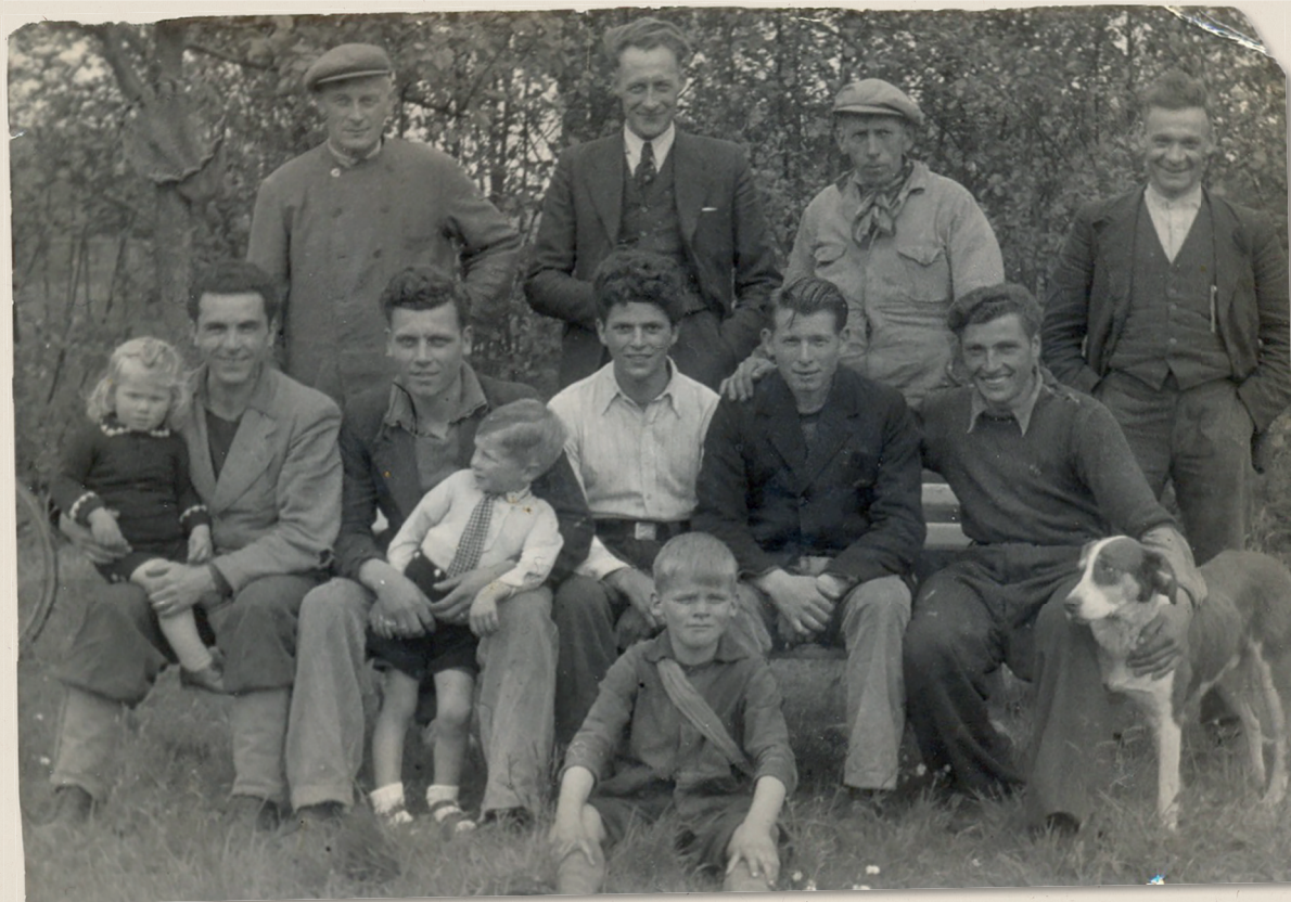
Ook in het boerdendorp Benschop zitten Italianen ondergedoken. Ze communiceren via de pastoor, die Latijn met hen spreekt. Na de bevrijding gaan ze met hun gastgezinnen op de foto.