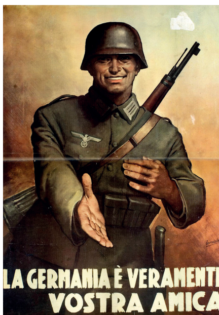
'Duitsland is echt uw vriend.' Italiaanse propagandaposter uit 1943.