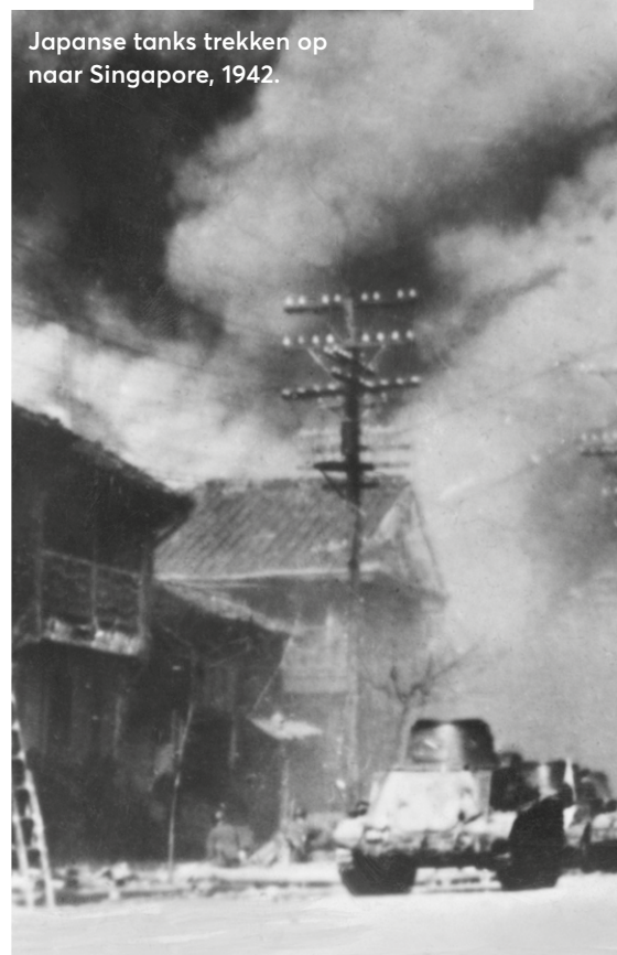
Japanse tanks trekken op naar Singapore, 1942.

Japan was toen al jaren aan een opmars in Azië bezig. In 1931 was het de Chinese regio Mantsjoerije binnengevallen, in 1937 had het grote kustgebieden in China bezet. Hoewel Japan zich militair als tegenstander van formaat had bewezen – in de Russisch-Japanse oorlog van 1904-1905 waren de Russen vernietigend verslagen – beschouwden de Europeanen de legers nog steeds als inferieur. De Britse premier Winston Churchill omschreef Japanners zelfs als 'gele dwergen'. Toen de Duitsers en Italianen de Britse