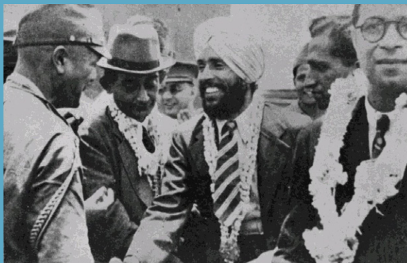
Mohan Singh Ghuman (met tulband) wordt begroet door de Japanse majoor Fujiwara Iwaichi, april 1942.

Nationalist Mohan Singh Ghuman werd in december 1942 door de Japanners gearresteerd toen hij doorkreeg dat zijn Indian National Army slechts diende als aanvulling van het Japanse leger en van een echte onafhankelijkheidsstrijd in India geen sprake bleek. Toen Japan was gecapituleerd wilden de Britten hem berechten, maar na felle protesten werd hij alleen ontslagen uit het leger. Hoewel hij buiten India onbekend is gebleven, wordt Singh in het land gezien als degene die het einde van de Britse overheersing in gang zette. In 1947 werd de kolonie opgedeeld in Pakistan en India. Singh ging verder als politicus van de Congrespartij (Indian National Congress) en werd parlamentslid. Hij zette zich met name in voor veteranen.