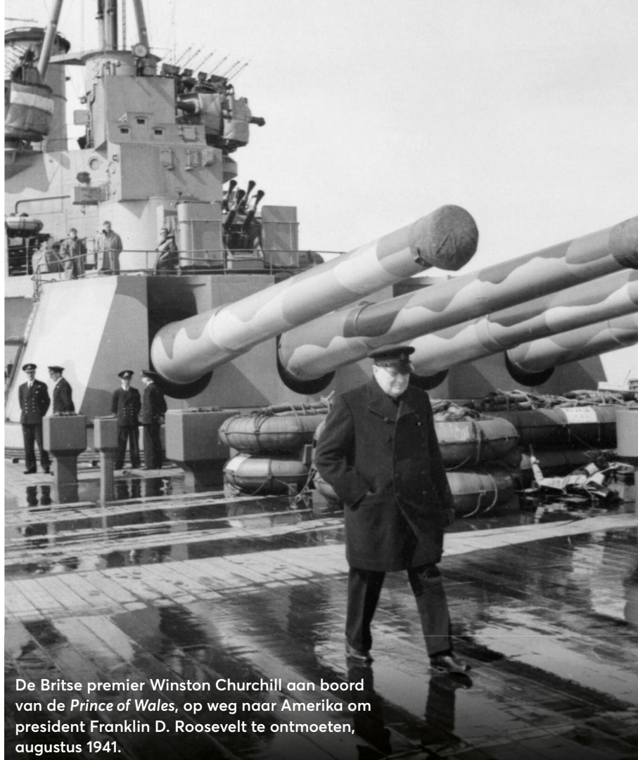
De Britse premier Winston Churchill aan boord van de Prince of Wales , op weg naar Amerika om president Franklin D. Roosevelt te ontmoeten, augustus 1941.

In 1819 was Singapore nog een vissersdorp. Vanwege de strategische ligging aan de Straat van Malakka, een belangrijke vaarroute tussen India en China, stichtte de Britse koloniale officier Thomas Stamford Raffles er dat jaar een handelspost. Die zou in honderd jaar uitgroeien tot de grootste stad en belangrijkste doorvoerhaven van Zuidoost-Azië. De Britten haalden duizenden arbeiders uit China en India; ze waren al snel talrijker dan de lokale Maleisische bevolking. Terwijl zij werkten, strooiden hun Britse meesters met geld in exclusieve witte clubs. Na de Eerste Wereldoorlog groeide Japan uit tot een industriële en militaire macht die lonkte naar andere gebieden in Azië. De Britten onderkenden het gevaar en begonnen Singapore te versterken met kustbatterijen. Hun 'Singapore-strategie' hield in dat bij een eventuele oorlog met Japan de marinehaven de uitvalsbasis zou zijn voor de Britse Royal Navy. Deze vloot moest de Japanse expansie stoppen en de