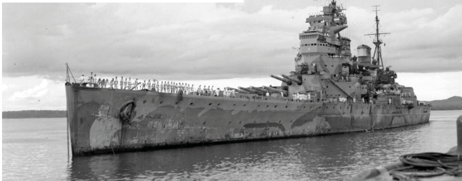
Het slagschip Prince of Wales meert aan in Singapore, 4 december 1941.

voor hun gehate 'witte' meesters en dat ze aan hun lot werden overgelaten. Duizenden liepen over naar de Japanners, die hen opriepen samen te strijden tegen de Europese overheersing van Azië. Ze werden geleid door de anti-Britse nationalist Mohan Singh Ghuman (zie kader op p. 19). Ook de Maleisische bevolking was onder de indruk van de Japanners. Overal werd de Europese bevolking geëvacueerd, onder hen heerste totale paniek. Dat mede-Aziaten de Europeanen konden verslaan, hadden de Maleisiërs nooit voor mogelijk gehouden. Ze hielpen de Japanners massaal bij het repareren van hun