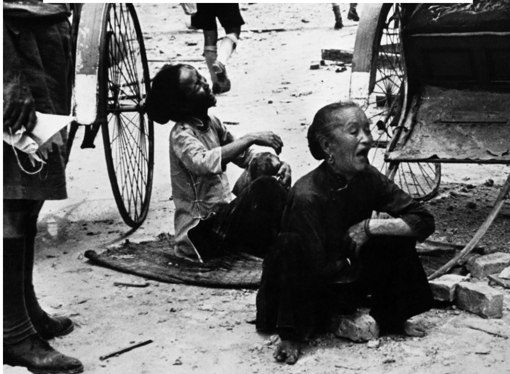
Een Chinese moeder en grootmoeder rouwen om een kind dat is omgekomen bij Japanse bombardementen op Singapore, januari 1941.