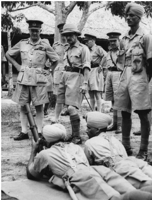
Generaal Archibald Wavell inspecteert de Brits-Indische verdediging van Singapore, januari 1942.