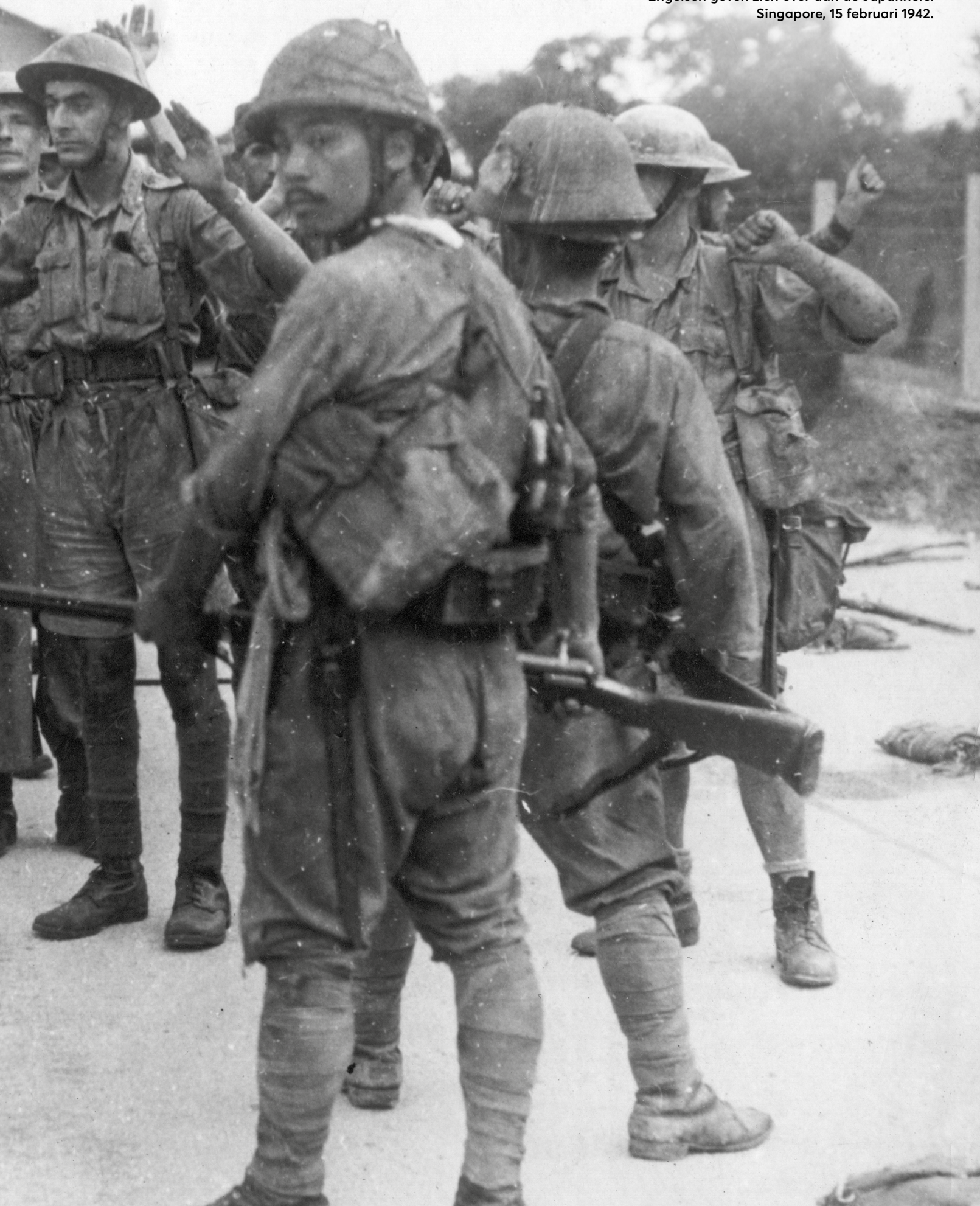
Engelsen geven zich over aan de Japanners. Singapore, 15 februari 1942.