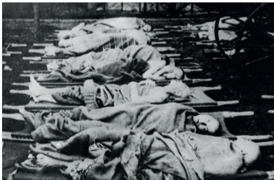
Zieke gevangenen worden aan hun lot overgelaten, 1945.

deelden op het drie lagen tellende stapelbed een strozak en deken. Iedereen had last van dysenterie en diarree. Degenen die op het onderste bed sliepen waren de pineut. Ook Grisnigt leed aan diarree. Terwijl hij zich op een nacht naar de latrine haastte, liet hij in de barak de boel per ongeluklopen. De Duitse kapo