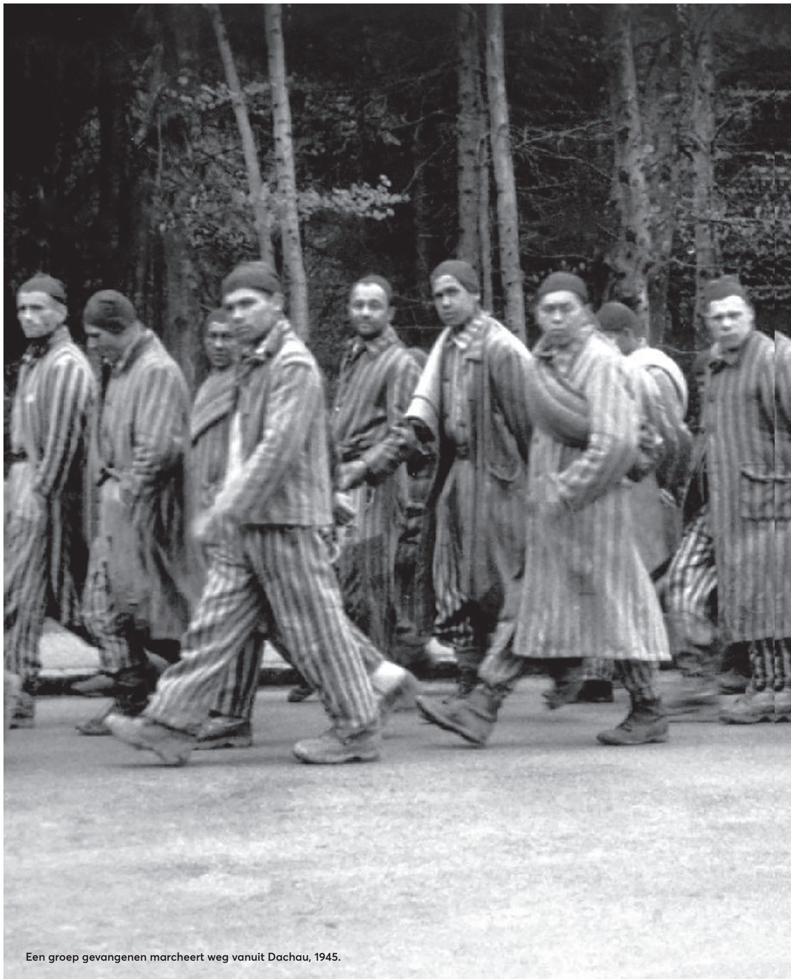
Een groep gevangenen marcheert weg vanuit Dachau, 1945.