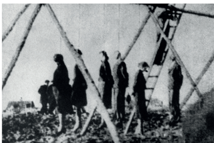
Gevangenen worden om de geringste overtreding opgehangen, 1945.