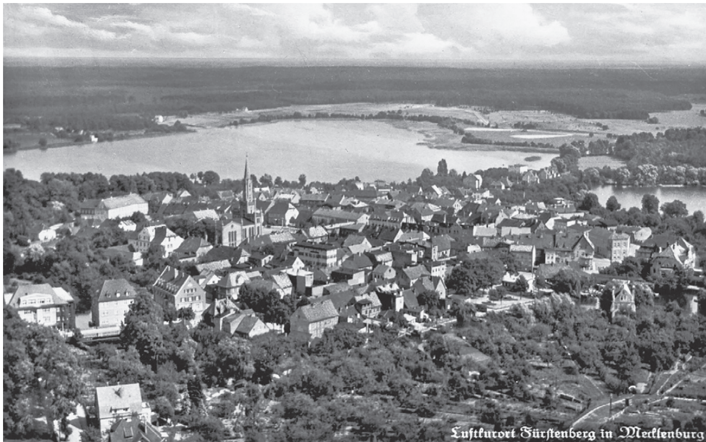
De omgeving van het kamp ten noorden van Berlijn is idyllisch.

ervan rook je overal. Donker: 'Daar zat ik dag aan dag tegenaan geleund. We waren volkomen immuun geworden.' Maar de smerigheid en honger vond hij het ergst. 'Ik maakte per dag 600 à 700 luizen dood en waste me driemaal, maar na een paar uur was het weer hetzelfde.' Eten kregen ze zelden. En als het er was, waren er geen schaaltes. 'Dan groef je als een hond in de grond om een schaalte te zoeken. Meer dan een halve liter kregen we nooit. Elke dag was het weer hopen en wachten.' Grisnigt: 'We riepen allemaal: "Roeren!" tegen de opschepper. Want onderin zaten de knollen en aardappels. Kreeg je die, dan had je kans een paar dagen langer te leven.'