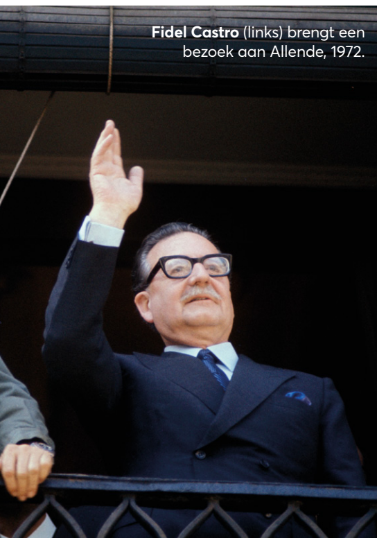
Fidel Castro (links) brengt een bezoek aan Allende, 1972.