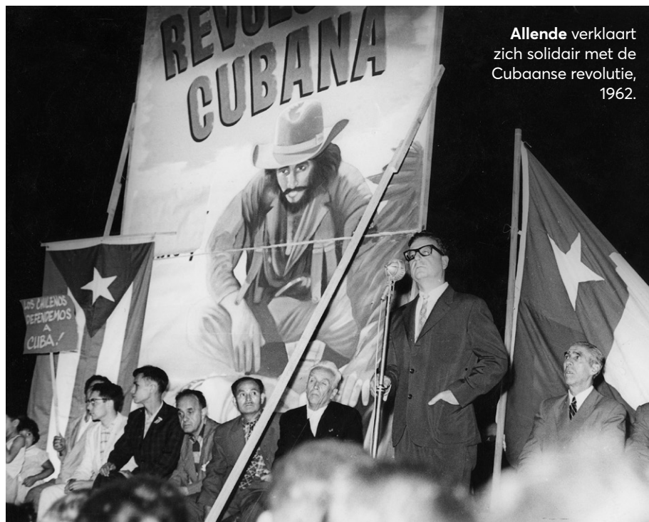
Allende verklaart zich solidair met de Cubaanse revolutie, 1962.

Sinds 11 maart 2022 is Gabriel Boric (1986) president van Chili. Ook hij is leider van een linkse coalitie met daarin communisten: Apruebo Dignidad ('Ik stem voor waardigheid'). In zijn verkiezingsprogramma kondigde hij aan de omstandigheden van de armen in Chili te willen verbeteren en de rijken zwaarder te zullen belasten. Daarnaast heeft hij veel aandacht voor het milieu, klimaat en minderheden. In zijn kabinet zijn 14 van de 24 leden vrouw. Minister van Defensie is socialist Maya Fernández Allende – een kleindochter van.