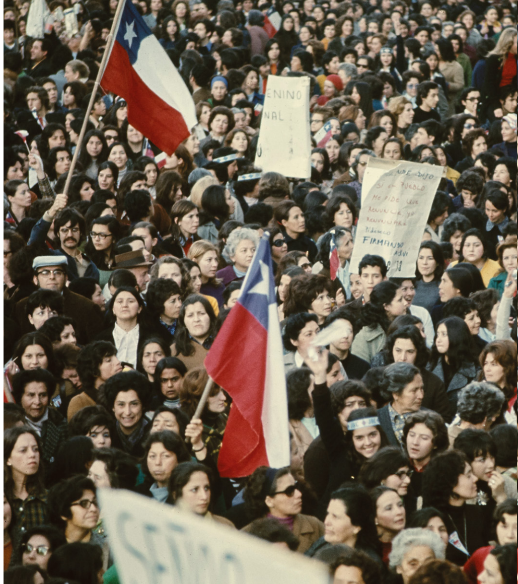
Vrouwen demonstreren tegen de regering van Allende, september 1973.