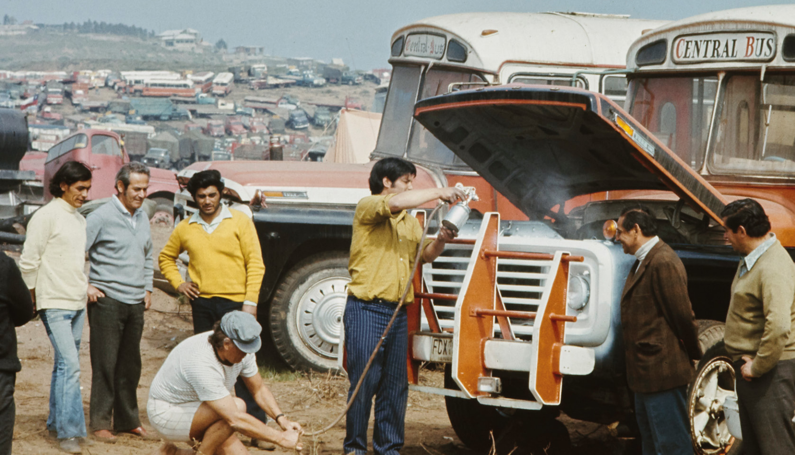
Stakende vrachtwagenchauffeurs leggen het land plat, september 1973.

Het kantelpunt was toen overigens al bereikt: doordat de arbeiders meer verdienden steeg hun koopkracht, maar de productie kon de vraag niet bijhouden. De invoer van buitenlandse producten liep spaak door een gebrek aan geld, omdat het congres belastingverhoging blokkeerde – de christen-democraten kozen daarbij de kant van de oppositie. Noodgedwongen ging de regering geld bijdrukken, met stijgende prijzen en hyperinflatie tot gevolg. Daarnaast was onverdraagzaamheid de UP-aanhang niet vreemd. Politiek tegenstanders werden op massabijeenkomsten uitgemaakt voor ‘mummies’. Als landhervormingen naar hun smaak niet ver of snel genoeg gingen, namen »