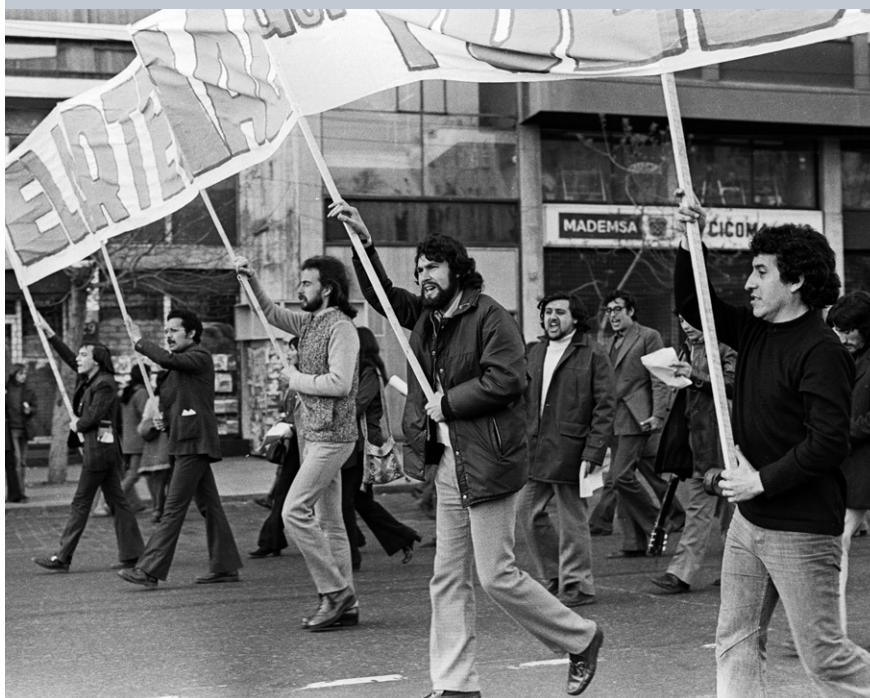
Víctor Jara (rechts) betuigt steun aan Allende, 4 september 1973.

Na Allendes laatste toespraak vertrok zanger Víctor Jara met zijn gitaar naar de technische universiteit in Santiago om daar met studenten de democratie te verdedigen. De volgende dag werden ze door militairen gearresteerd en weggevoerd naar een sportstadion. Jara werd daar herkend en mishandeld. Op 16 september werd zijn levenloze lichaam bij een kerkhof in de stad gevonden. Het was doorzeefd met kogels en zijn handen waren verbrijzeld. In 2018 werden negen voormalige militairen die betrokken waren bij zijn dood veroordeeld tot lange gevangenisstraffen. Het sportcomplex in Santiago waar hij stierf werd in 2003 omgedoopt tot Estadio Víctor Jara.